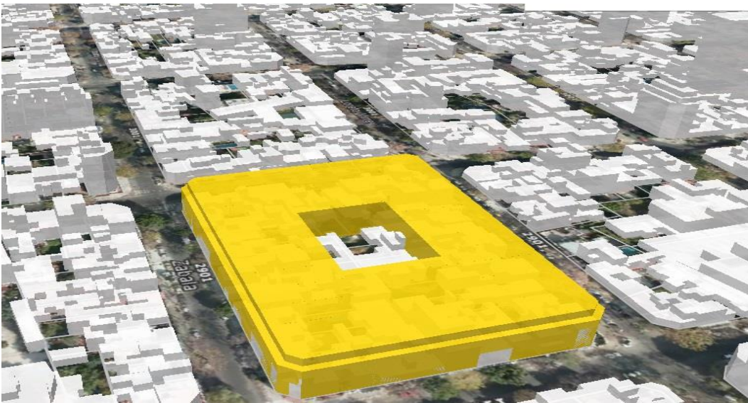
Manzana según CUr.