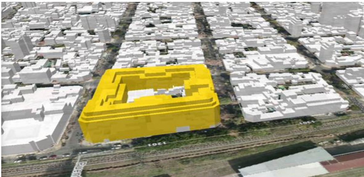
Manzana según CUR.