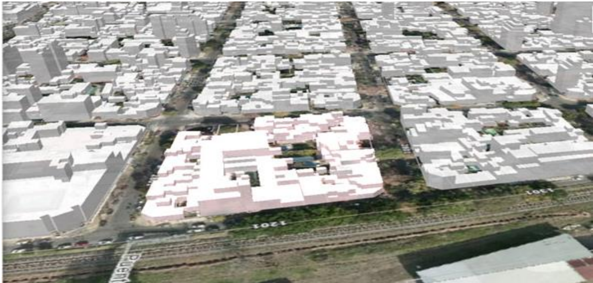
Manzana consolidada según CPU