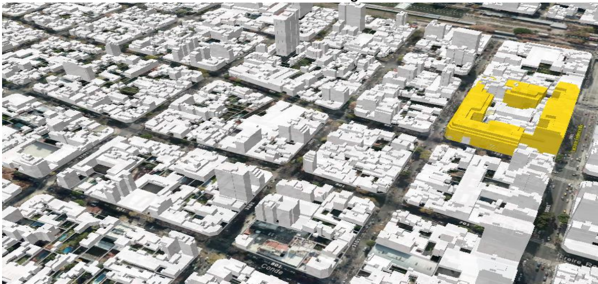
Manzana según CUR.