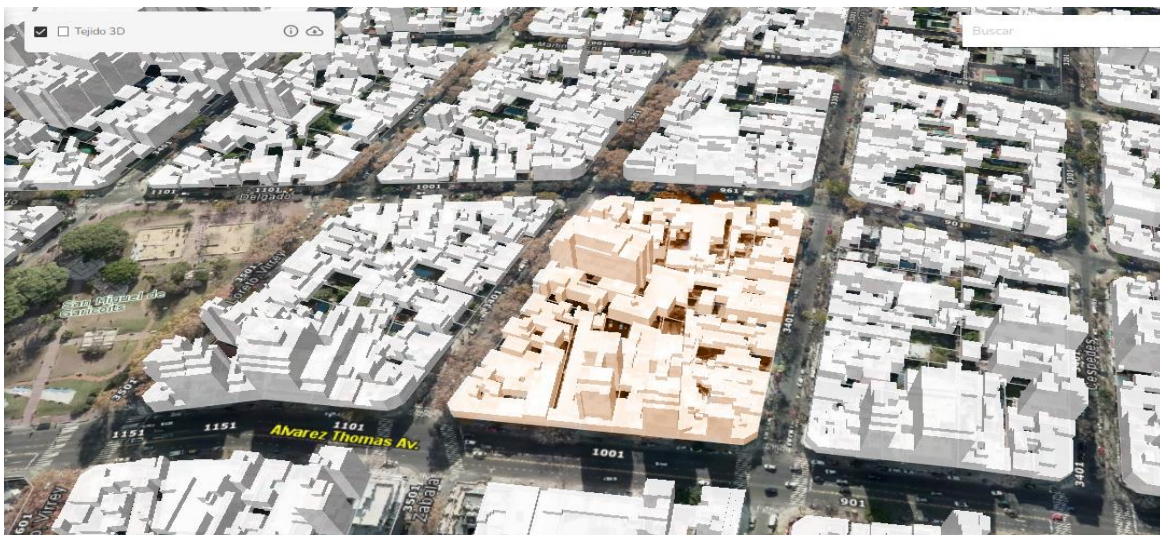
Manzana consolidada según CPU