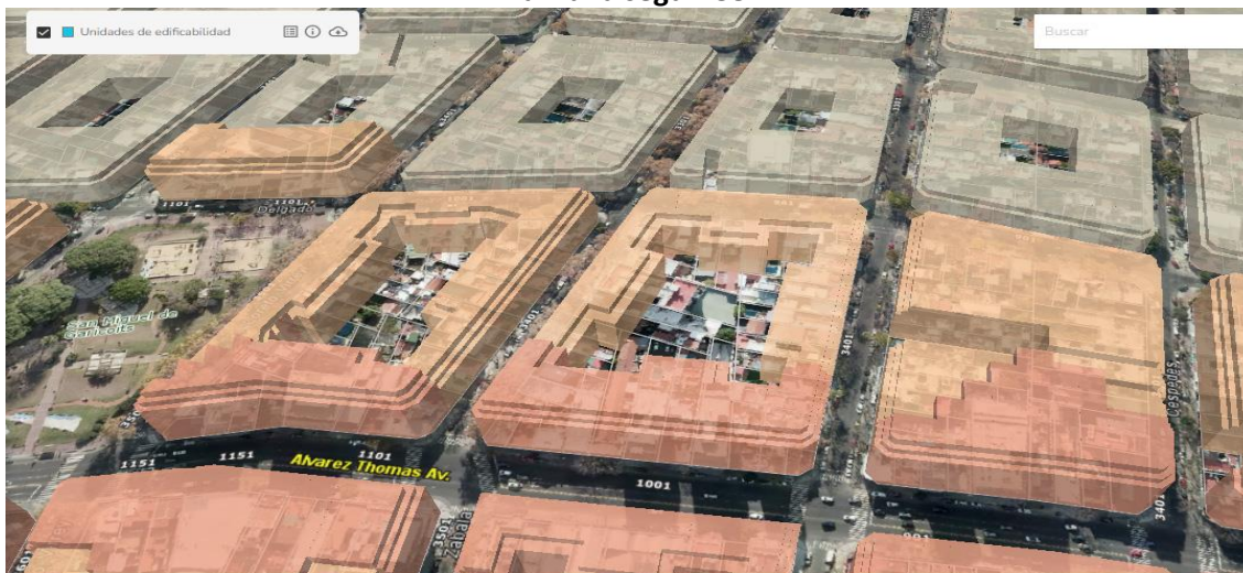
Área según Cur