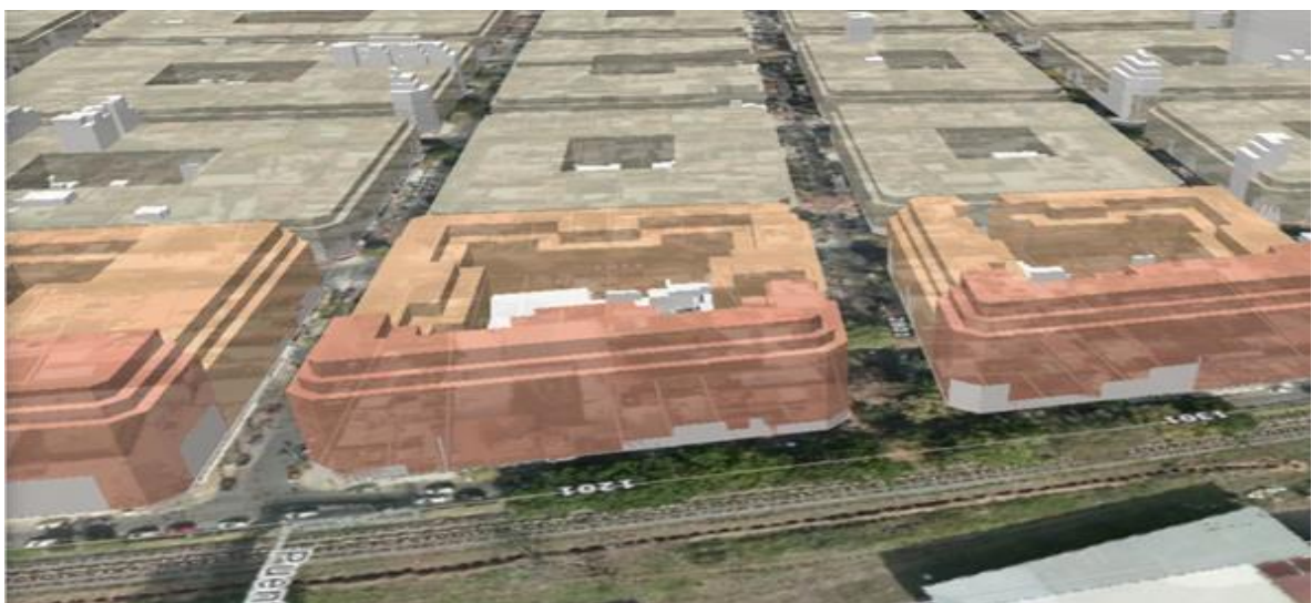
Área según Cur