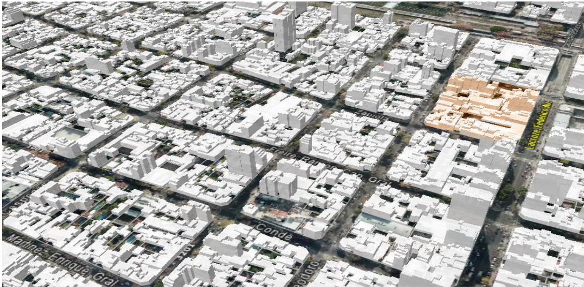
Manzana consolidada según CPU

R2b1 Vs USAM – Manzana 83 - Zapiola, Teodoro García, Freire y Av. Lacroze.