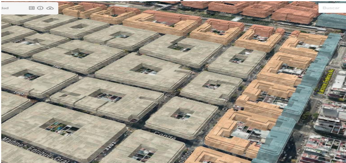
Área según Cur