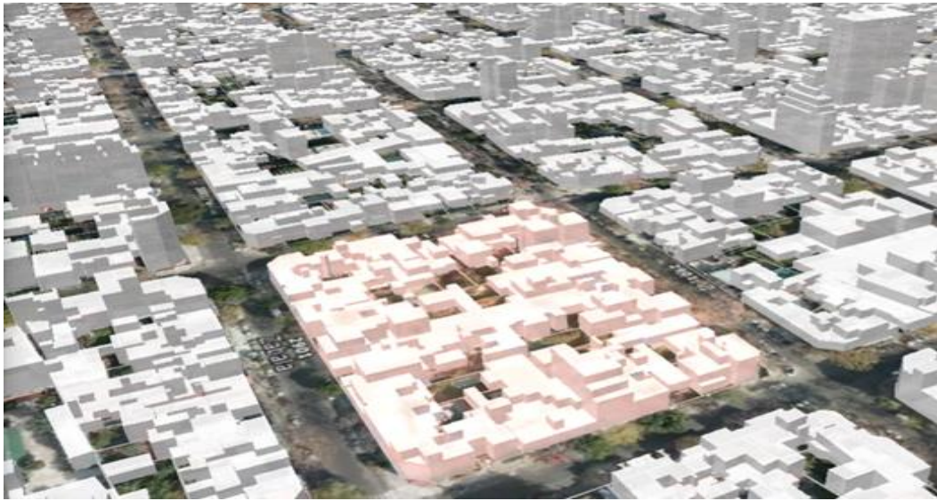
Manzana consolidada según CPU