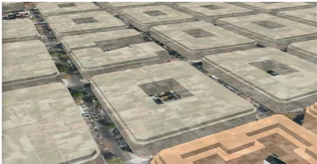
Área según Cur